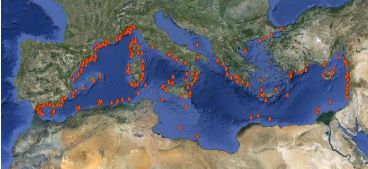
Figura 1: Distribución de los principales cañones identificados en el Mediterráneo (según los autores del Documento y [3], [6]).