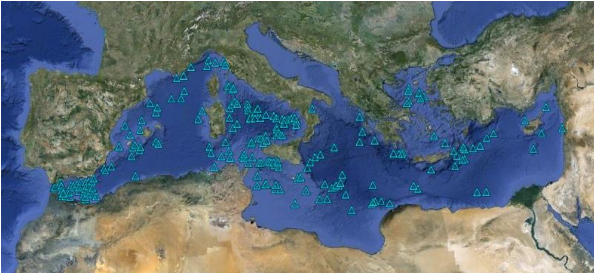
Figura 4: Distribución de los principales montes marinos en el Mediterráneo

(Figura 4), con más de 127 de ellos a nivel del mar Tirrénico y el estrecho entre Sicilia y Túnez.