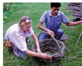
Oikos CEE Regional Meeting on Sustainable Agritourism, Georgia