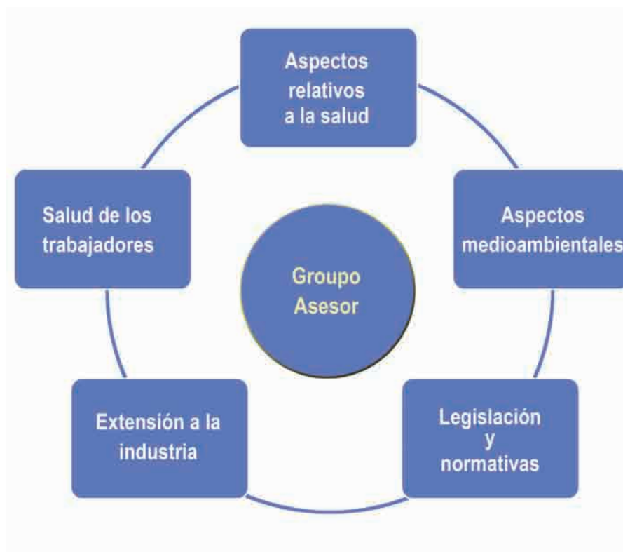
Figura 2: estructura del Grupo Asesor y de los grupos de trabajo temáticos de la Alianza Mundial