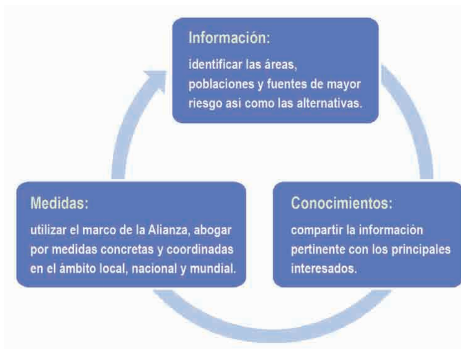
Figura 1 : Estrategia de la Alianza Mundial para las actividades relacionadas con la información, los conocimientos y las medidas por aplicar