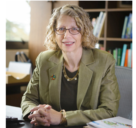
英格·安德森（Inger Andersen） 联合国环境规划署执行主任 联合国副秘书长