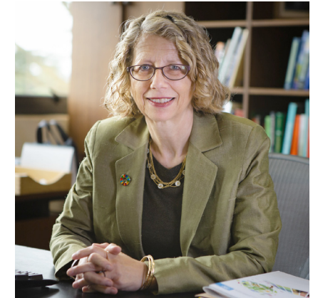
Inger Andersen Director Ejecutivo del Programa de las Naciones Unidas para el Medio Ambiente y Secretario General Adjunto

— Inger Andersen, Directora Ejecutiva del PNUMA