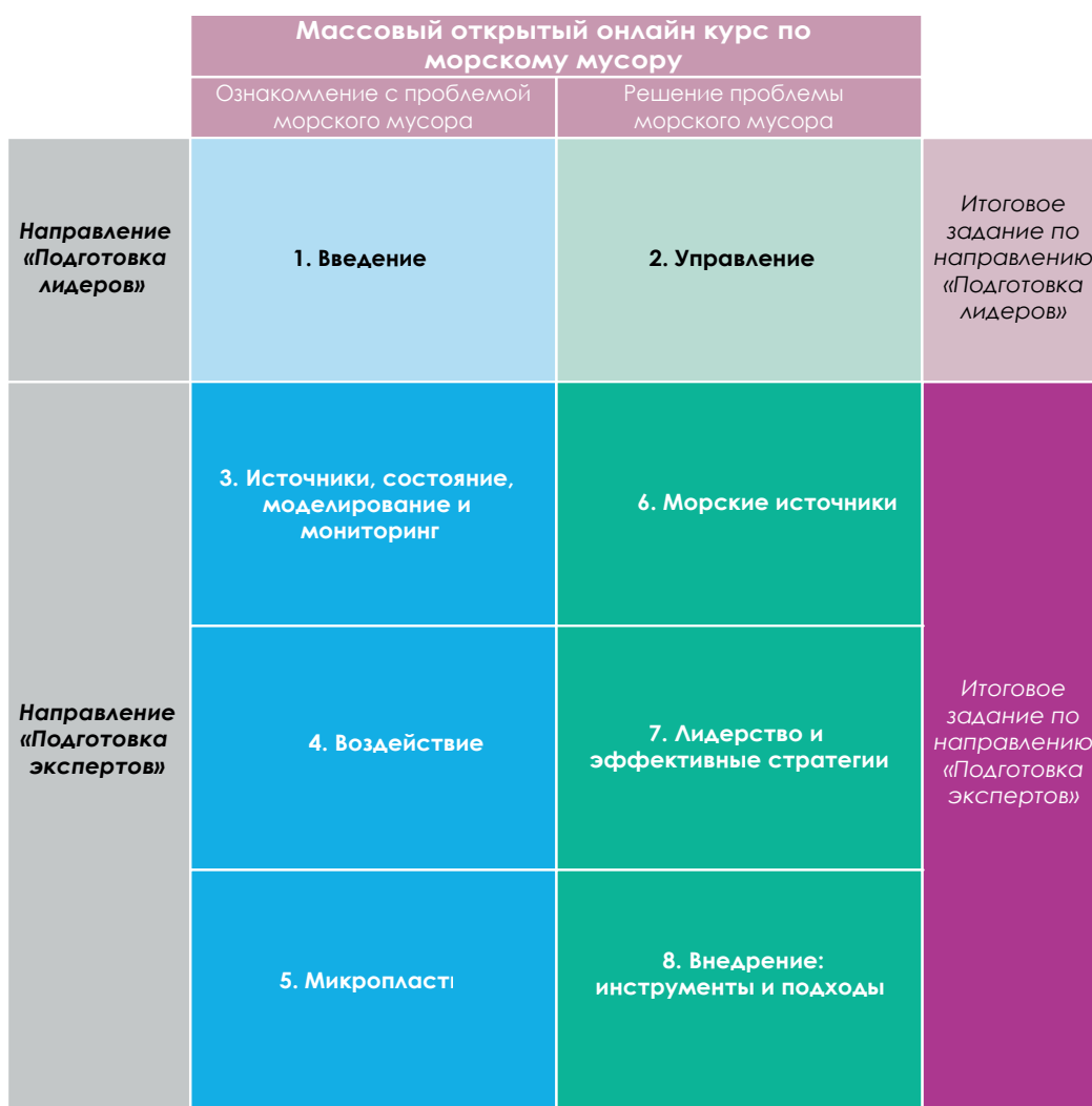
Рис 1: Структура массового открытого онлайн курса по морскому мусору