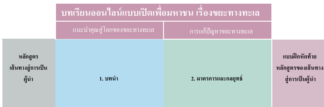
ภาพที่ 1 บทเรียนออนไลน์แบบเปิดเพื่อมหาชน (Massive Open Online Course) เรื่องขยะทางทะเล