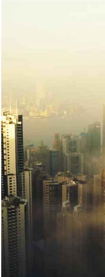
Айнарс Дятлевскис, Unsplash