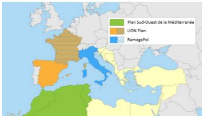
Accords multilatéraux portant Plans d'urgence sous-régionaux en Méditerranée occidentale (Cedre 2019)

.3 Accord portant plan d'urgence sous-régional entre l'Algérie, le Maroc et la Tunisie pour la préparation à la lutte et la lutte contre la pollution marine accidentelle dans la zone de la Méditerranée du sud-ouest (2005).