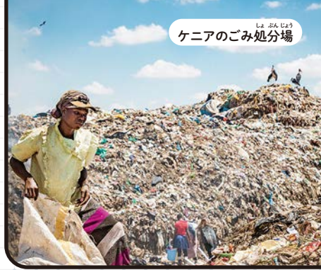
ケニアのごみ処分場

みなは世界で毎日どれくらいのごみが出ているか知っているかな? 正解は東京ドーム約4杯分。出されたごみが完全になくなることはないんだ。全体の約20%はリサイクルされるけど、残りは燃やされたり、土に埋められたり、自然に流れ出てしまっているよ。自然や動物、そして私たち人間にとってかけがえのない地球を守るには、一人一人の環境への思いやりが大切だよ。