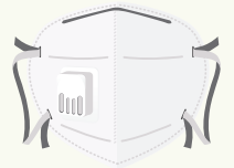
الشكل 3: غطاء الوجه الأساسي الذي يمكن التخلص منه/يستعمل لمرة واحدة

يبين الشكل 3 قناع الوجه القياسي الذي يتطابق مع الحد الأدنى من المعايير والذي يجب أن يستخدمه أي شخص يتعامل مع المواد التي تحتوي على الأسبستوس أو يتواجد بالقرب منها في حال عدم توفر أقنعة ذات نوعية أفضل. يجب أن يكون هذا الجهاز مناسباً لمعظم الأعمال القصيرة المدة غير الحاصلة على ترخيص، لا سيما أنشطة إزالة المخلفات والتخلص من المواد التي تحتوي على الأسبستوس في الهواء الطلق.