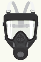
الشكل 1: غطاء كامل للوجه

يجب بذل الجهود لاستخدام أفضل نوعية من القناع المتوفر والعمل خلال فترات طويلة من الأعمال المتعلقة بالهدم. يبين الشكل 1 نوع القناع الذي يغطي الوجه بالكامل والذي يجب أن يستخدمه الأشخاص الذين يتعاملون مع المواد التي تحتوي على الأسبستوس أو يتواجدون بالقرب منها لفترات طويلة. يجب أن تتطابق أقنعة الوجه الكاملة مع معيار (BS EN 136) مع فیلتر P3 ويجب استخدامها من قبل المشغلين الحاصلين على ترخيص.