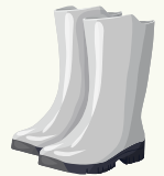
الشكل 5: جزمة من نوع ويلينغتون

تشكل الأحذية المناسبة جزءاً مهماً من معدات الوقاية الشخصية المطلوبة عند التعامل مع المخلفات الملوثة بالأسبستوس. من المستحسن أن يرتدي جميع المشاركين في هذا العمل جزمة من نوع ويلينغتون المصممة خصيصاً لهذا الغرض. يجب أن تكون الأحذية مطابقة لمعيار EN ISO 20345:2011 لتوفير حماية قوية للنعل من الاختراق ويجب أن تكون مقدمة الحذاء فولاذية. يتضمن الشكل 5 نموذجاً من هذه الأحذية.