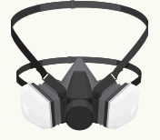
الشكل 2: غطاء الوجه القابل لإعادة الاستخدام

إذا لم يكن قناع الوجه الكامل متوفراً للأشخاص الذين يتعين عليهم إزالة المخلفات التي تحتوي أو يمكن أن تضم مواد تحتوي على الأسبستوس، يجب استخدام قناع الوجه الذي يغطي الأنف والفم. يبين الشكل 2 قناعاً قابلاً لإعادة الاستخدام (المعيار المطبق EN140 مع فیلتر P3)، يغطي الأنف والفم فيكون مناسباً للأشخاص الذين يعملون لفترات منتظمة في إزالة المخلفات.