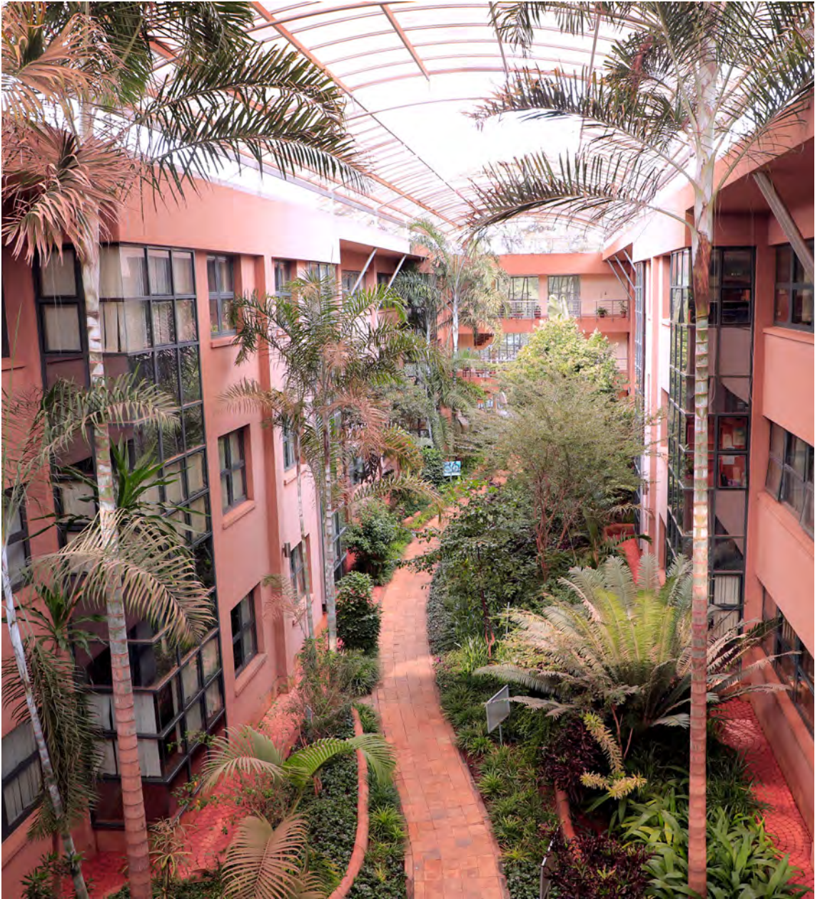
Sede del Programa de las Naciones Unidas para el Medio Ambiente en Nairobi (Kenya).