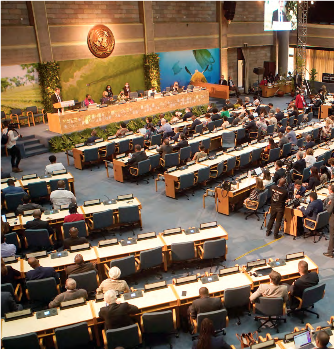
Apertura de la serie de sesiones de alto nivel durante la continuación del quinto período de sesiones de la Asamblea de las Naciones Unidas sobre el Medio Ambiente, el 1 de marzo de 2022 en Nairobi (Kenya).