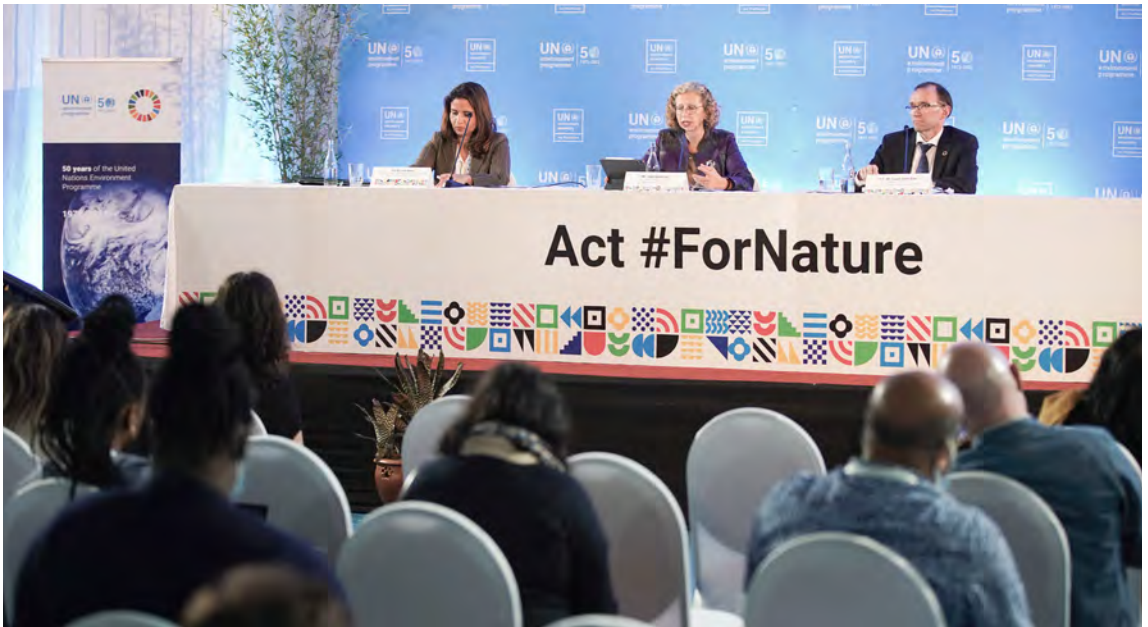
Conferencia de prensa de clausura del quinto período de sesiones de la Asamblea sobre el Medio Ambiente.

La División de Comunicaciones del PNUMA es responsable de la comunicación estratégica, la divulgación en los medios, la promoción, la sensibilización y la creación de marca en relación con la Asamblea sobre el Medio Ambiente. A continuación se describen las funciones que supervisa.