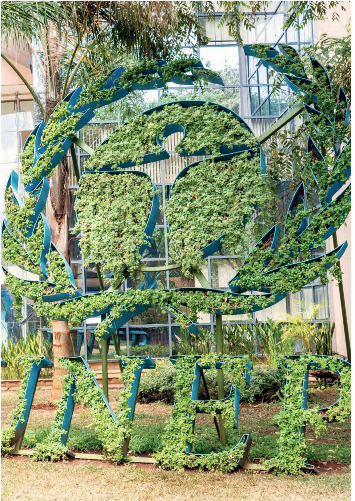
Entrada de la sede del Programa de las Naciones Unidas para el Medio Ambiente en Nairobi (Kenya)..