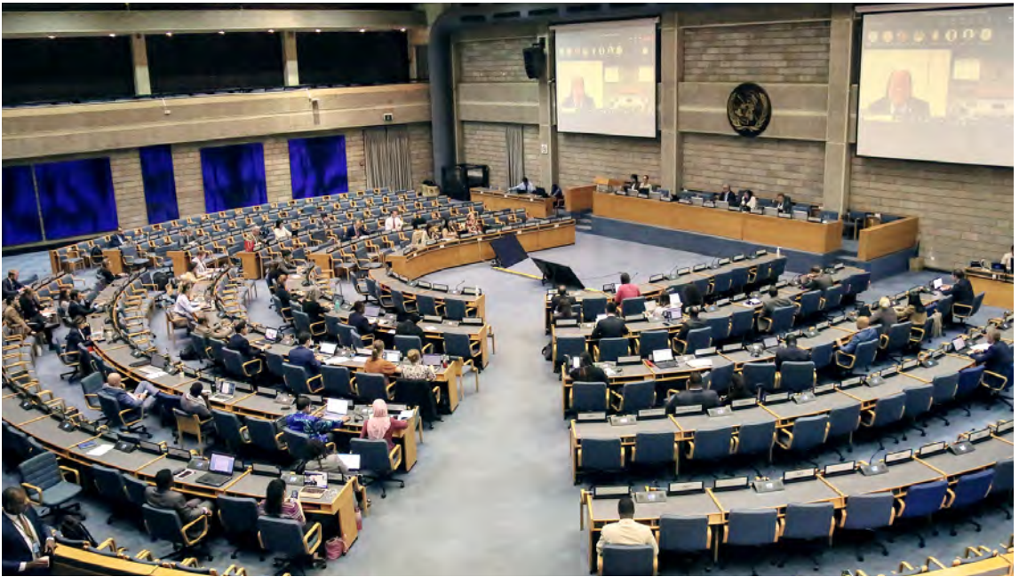
Reunión del subcomité del Comité de Representantes Permanentes celebrada el 21 de septiembre de 2023 en Nairobi (Kenya).

El Comité de Representantes Permanentes es un órgano subsidiario entre períodos de sesiones de la Asamblea de las Naciones Unidas sobre el Medio Ambiente que examina periódicamente la aplicación de los resultados de la Asamblea; orienta en relación con la elaboración del programa de trabajo y presupuesto y vigila su ejecución, y supervisa la labor de la Secretaría. Todas las reuniones ordinarias del Comité, incluidas las del Comité de Representantes Permanentes de composición abierta, así como las reuniones de los subcomités, están abiertas a la participación de los representantes de los grupos principales y los interesados acreditados.