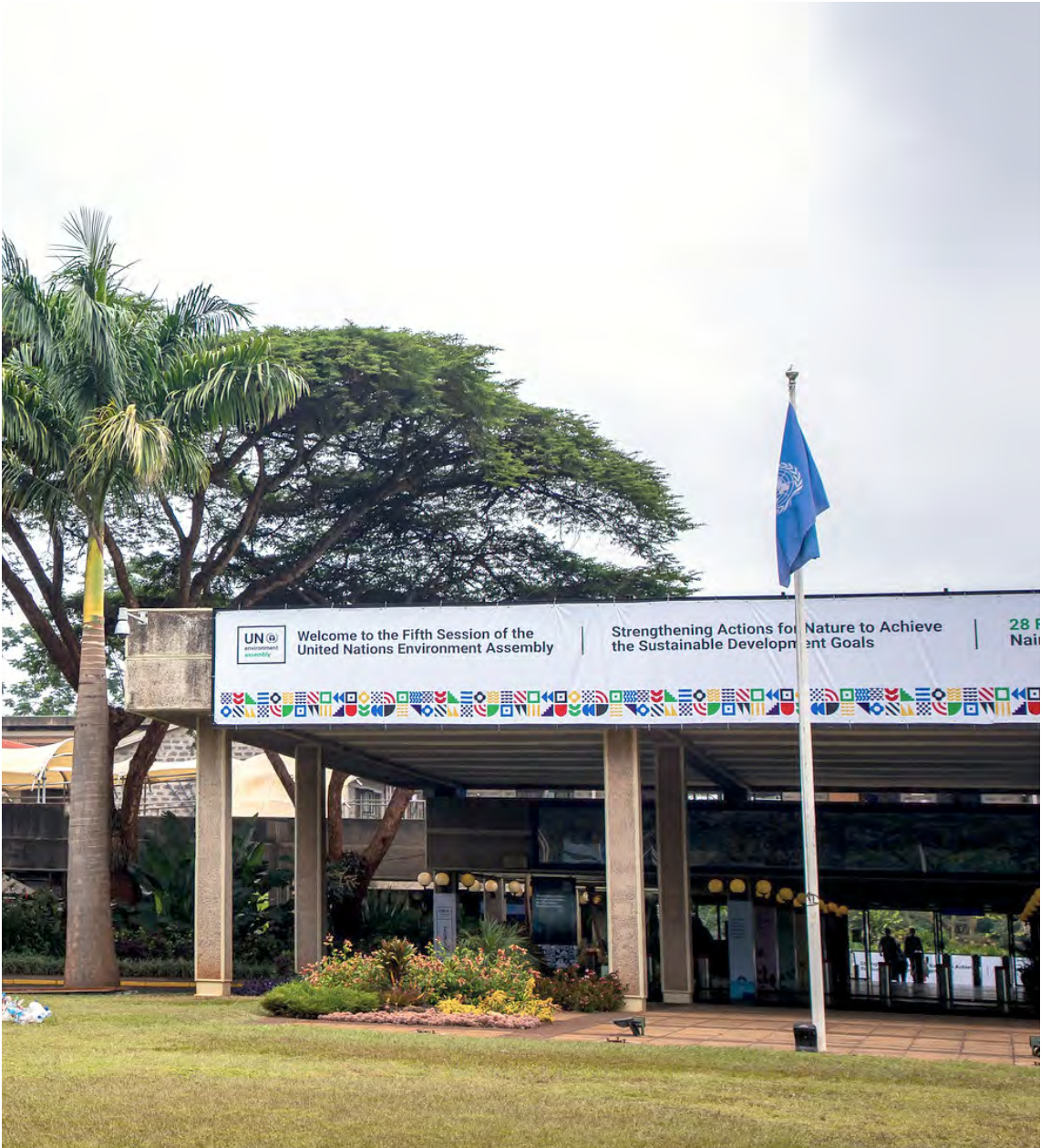
Entrada a la Oficina de las Naciones Unidas en Nairobi durante el quinto período de sesiones de la Asamblea sobre el Medio Ambiente.