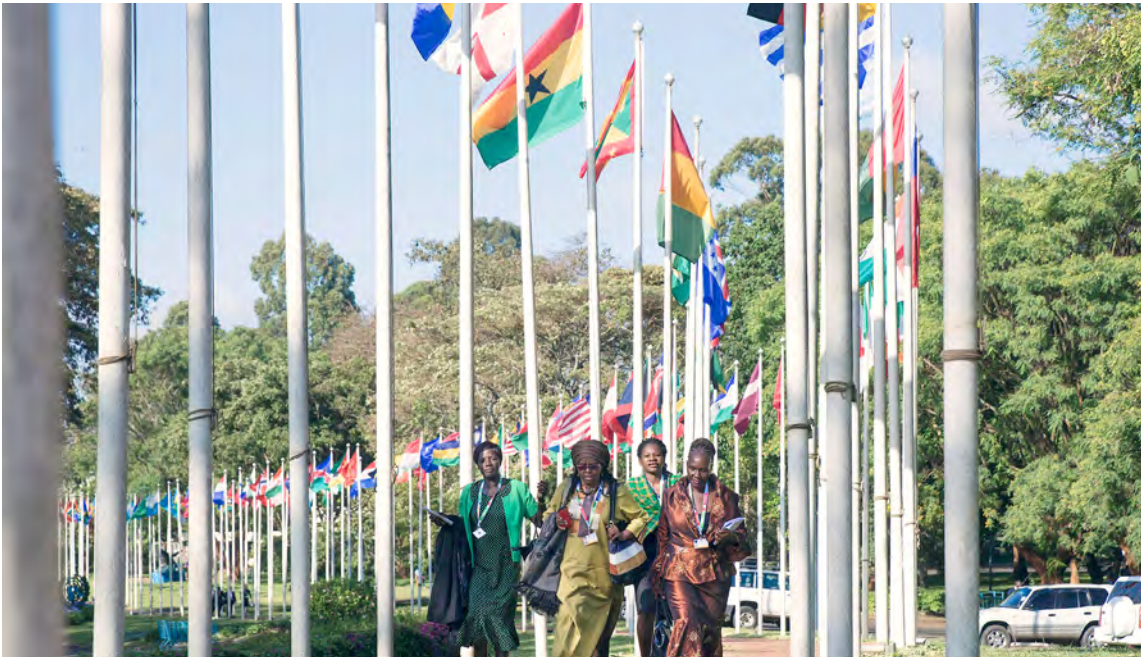
Delegados en el tercer período de sesiones de la Asamblea sobre el Medio Ambiente en diciembre de 2017