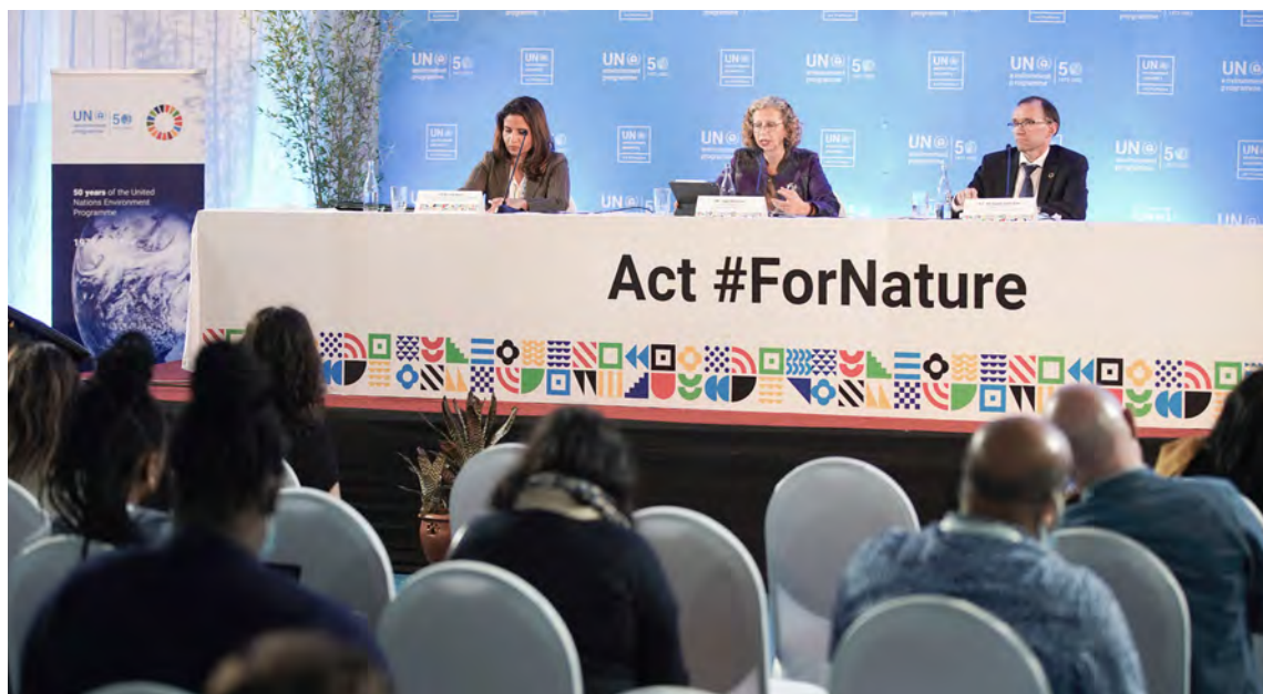
Заключительная пресс-конференция на пятой сессии Ассамблеи Организации Объединенных Наций по окружающей среде

Отдел коммуникаций ЮНЕП отвечает за коммуникационную стратегию, работу со СМИ, информационно-пропагандистскую деятельность, повышение осведомленности и символику Ассамблеи по окружающей среде. Ниже приведены направления деятельности, которые он курирует.