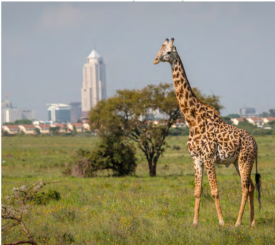
Вид на высотные дома в Найроби со стороны Национального парка

Кения: принимающая страна Программы Организации Объединенных Наций по окружающей среде и Ассамблеи Организации Объединенных Наций по окружающей среде