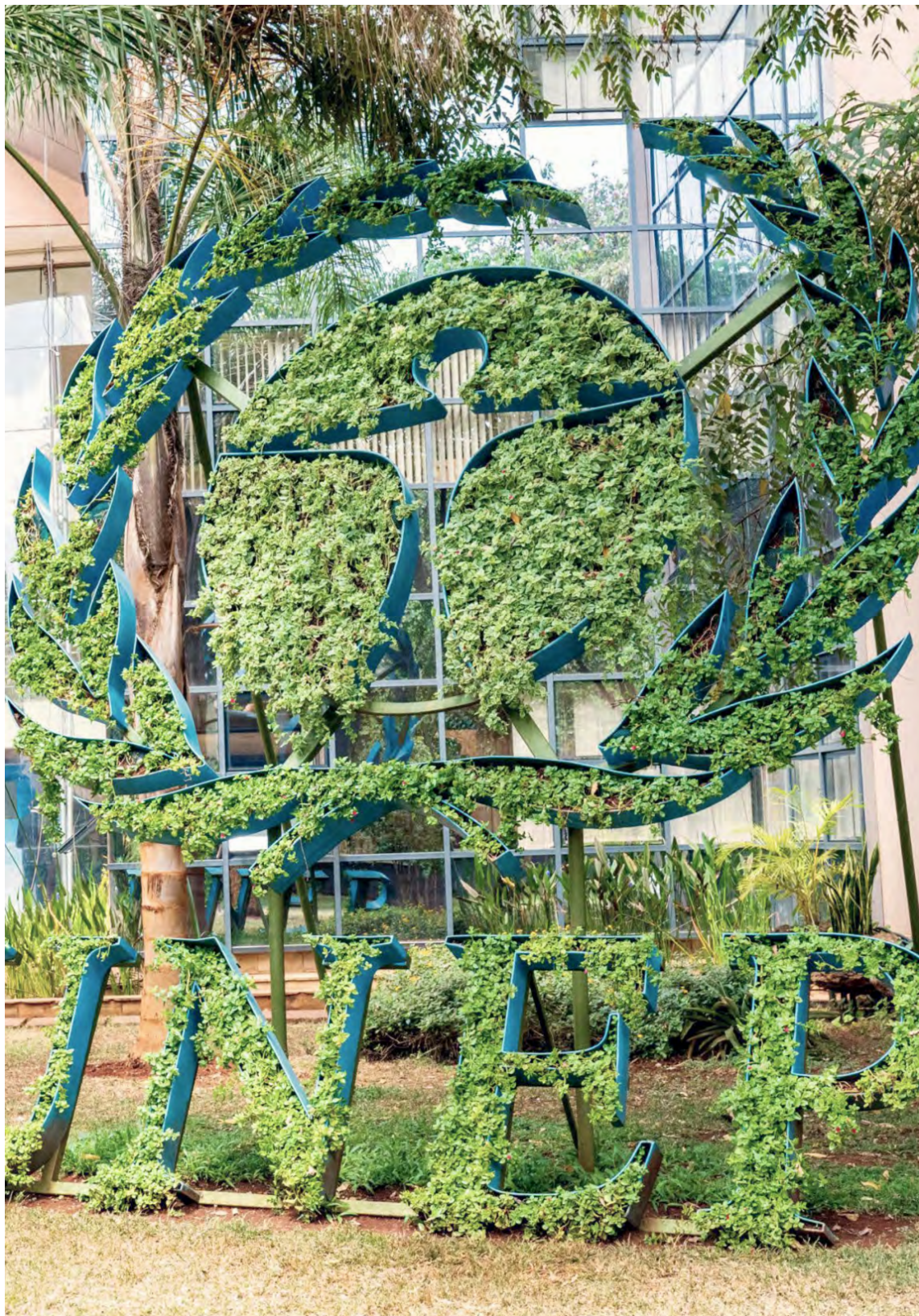
Вход в штаб-квартиру Программы Организации Объединенных Наций по окружающей среде в Найроби (Кения).