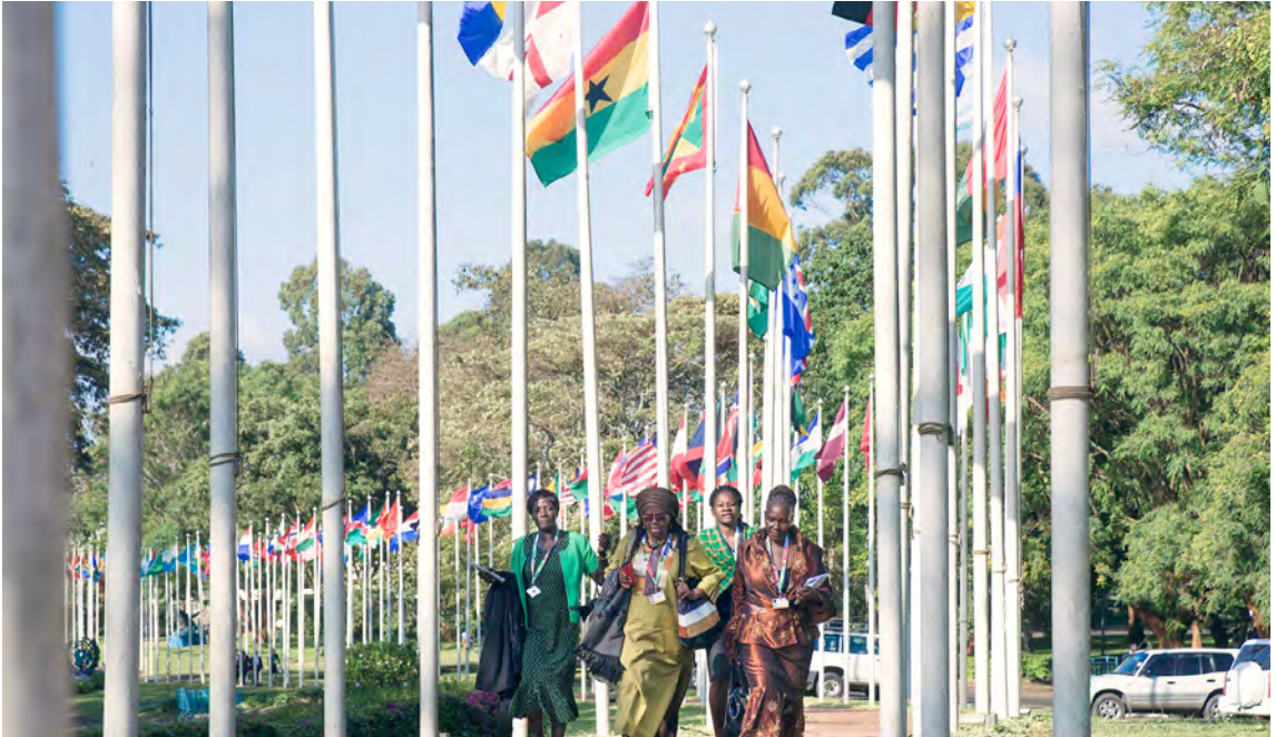
Делегаты на третьей сессии Ассамблеи Организации Объединенных Наций по окружающей среде в декабре 2017 года