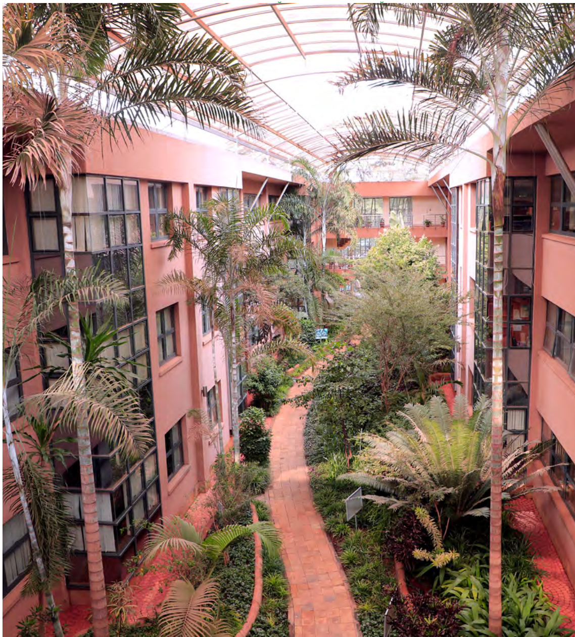
Штаб-квартира Программы ООН по окружающей среде в Найроби (Кения)