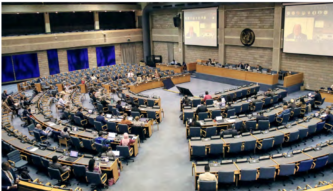
Совещание подкомитета Комитета постоянных представителей 21 сентября 2023 года в Найроби (Кения)

Комитет постоянных представителей является межсессионным вспомогательным органом Ассамблеи Организации Объединенных Наций по окружающей среде, который регулярно анализирует ход осуществления решений Ассамблеи, руководит разработкой программы работы и бюджета и следит за их осуществлением и осуществляет надзор за работой секретариата. Все очередные совещания Комитета, включая совещания Комитета постоянных представителей открытого состава, а также совещания подкомитетов, открыты для участия представителей аккредитованных основных групп и заинтересованных сторон.