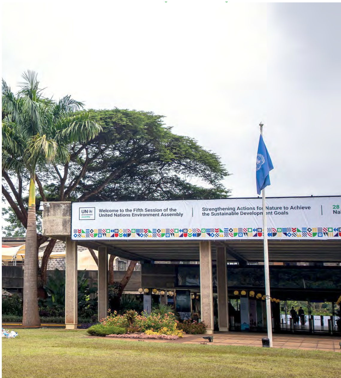
Вход в Отделение Организации Объединенных Наций в Найроби во время пятой сессии Ассамблеи Организации Объединенных Наций по окружающей среде