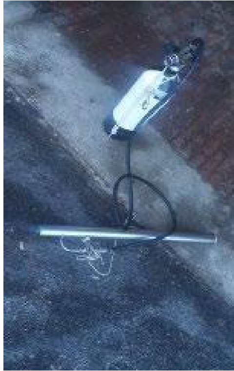
الصورة 5: السوربون