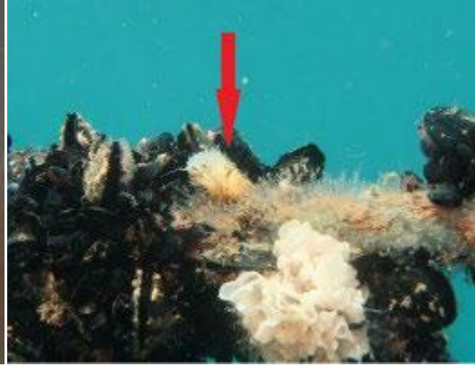
الصورة 3: بينا نوبيليس على الخيوط الطويلة