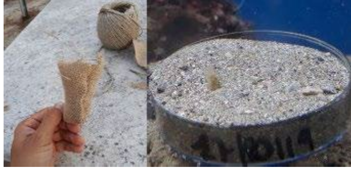
الصورة 6: كيس جوتا وطبق بيتري

بالنسبة لعمليات الاستقرار والنمو، يجب الاهتمام قبل كل شيء بالحفاظ على الظروف الكيميائية والفيزيائية المثلى. على الرغم من أن بيينا نوبيليس هو من الرخويات ذات الصدفتين شديدة المقاومة والتكيف (يعيش حتى لفترات قصيرة خارج الماء)، إلا أننا نحاول ألا نحدث تقلبات كبيرة في الخزانات أثناء عمليات الصيانة العادية. يجب تعديل الفترة الضوئية وفقاً لموسمية الجمع وتوزيعها تدريجياً وفقاً لتقدم الفصول. فيما يتعلق بالنمو، فمن الممكن المضي قدماً في إدخال العناصر الغذائية، أو إذا كان الخزان يحتوي بالفعل على نظام بيئي ناشئ (على الأقل 5 سم من الرواسب، وأحجار مختلفة، وكائنات نباتية وحيوانية موجودة)، فمن الممكن أيضاً عدم إدخال العناصر الغذائية للجماهير. إذا كانت الخزانات مملوءة بالماء فقط دون بدء أي نوع من النظام البيئي، فمن المستحسن إدخال مستنبت الطحالب الدقيقة المركز في الخزان مرة واحدة في الأسبوع.