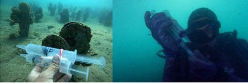
الصورة 7: العمليات تحت الماء

الخياشيم هذا المخاط الذي يعمل بمثابة الحماية من الترسيب الزائد. إذا كنت ترغب في تناول الكريات البرازية، فسيتعين عليك الانتباه إلى خروج القناة المذرقية للكائن الحي القريبة منها بشكل أو بآخر. إذا لم ينبعث الكائن الحي، يمكنك محاولة الطرق على الصمام، وبهذه الطريقة سينغلق الكائن الحي ويخرج كريات البراز. بعد أخذ العينات، يتم حفظ المواد البيولوجية في كحول (90 درجة) ووضعها في الثلاجة عند -80 درجة مئوية، وتكون جاهزة للتحليل الجيني.