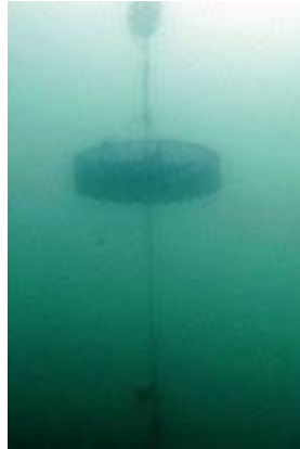
الصورة 1: جامع أفقي

ننتقل بعد ذلك إلى إعداد هيكل التظليل (الصورة 1) الذي يتكون من ثقل واحد، وحبل يبلغ الحد الأقصى لطوله 2 متر، والعوامة، والمجمع. من بين نظامي التجميع اللذين تم اختبارهما (الرأسي والأفقي) كان النظام الأفقي هو المفضل. لذلك يتم استخدام شبكة فانوس دائرية (أجهزة بلاستيكية تستخدم في تربية الحيوانات البحرية) حيث يمكن تثبيت أنواع مختلفة من المواد النسيجية لزيادة كفاءة التجميع. أبسط طريقة هي وضع بعض المواد النسيجية داخل الفانوس مثل كيس البطاطس وحقيبة الجوت والحبال وما إلى ذلك. تساعد هذه الطريقة الصغار على التصاق اليرقات.