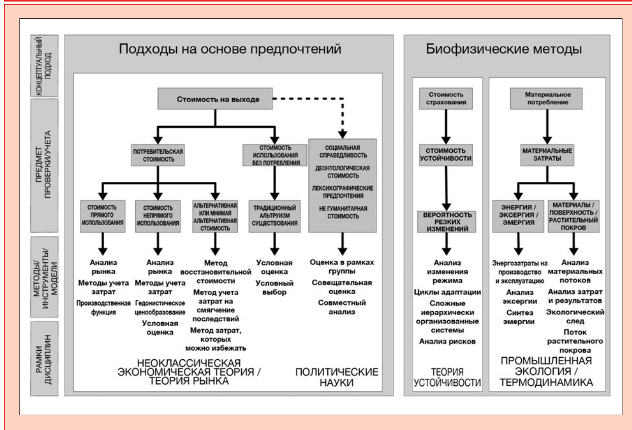
Рисунок 1. Методы оценки стоимости природы