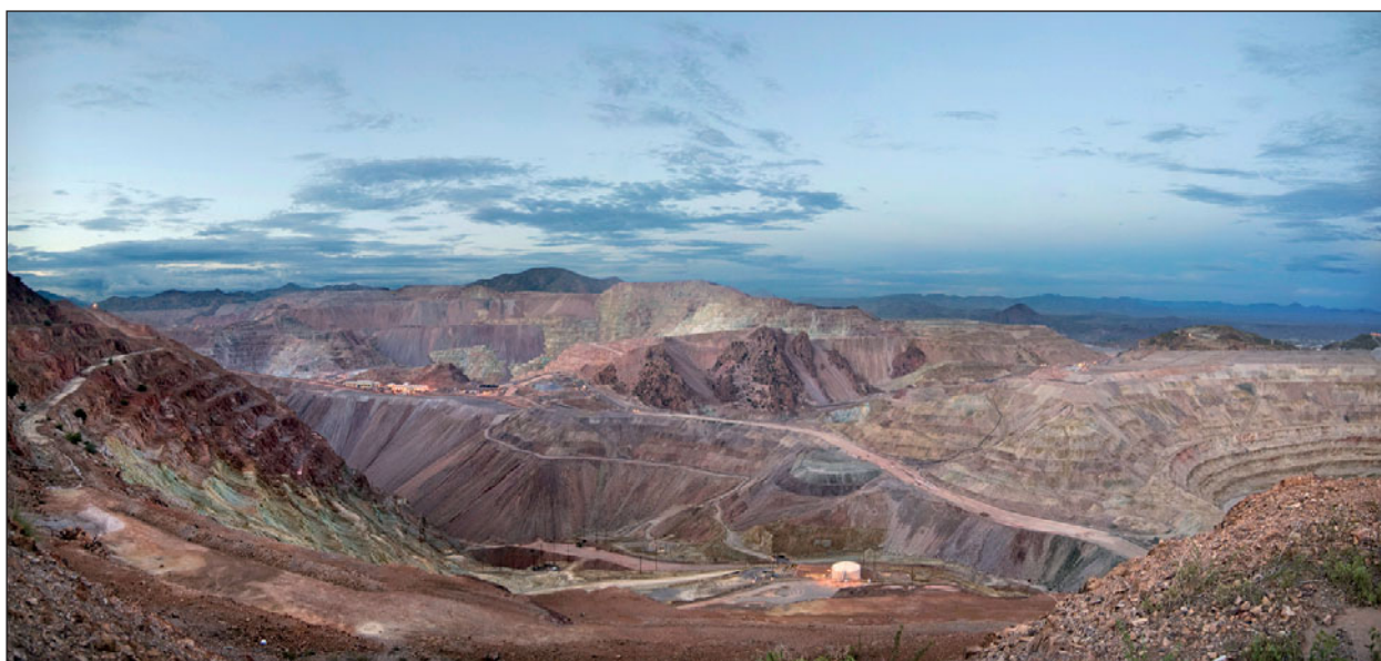
Morenci Mine, крупнейший медный рудник США: добыча полезных ископаемых может существенно изменить ландшафт.