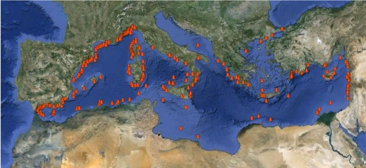
Figure 1: Distribution des principaux canyons identifiés en Méditerranée (d'après auteurs du document [3],[6]).