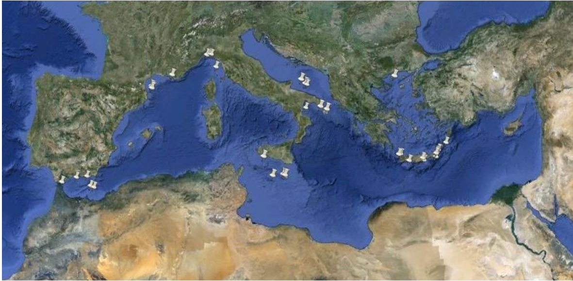
Figure 2: Localisation de quelques peuplements d'invertébrés structurants en Méditerranée. Ce sont majoritairement les « coraux d'eaux profondes » qui sont localisés (d'après auteurs du document &[8], [9], [10].

Aussi, leur présence peut être un préalable nécessaire à la mise en place de mesures de gestion spécifiques. S'ils sont actuellement encore peu pris en compte, en terme de conservation, puisque seul le « récif à Lophelia et Madrepora » de Santa Maria de Leuca est inscrit comme zone de pêche restreinte par la CGPM, depuis 2006[11], ils sont à l'origine de la création d'AMP (e.g. canyons de Cassidaigne et Lacaze-Duthiers - France). De même, deux sites ont été désignés, à ce titre, par l'Italie (Pentes continentales de l'Archipel toscan et secteur de Santa Maria de Leuca) pour la mise en œuvre du réseau Natura 2000 en mer et plusieurs sont inclus dans la proposition de mise en place d'un réseau représentatif d'AMP en mer d'Alboran [6].