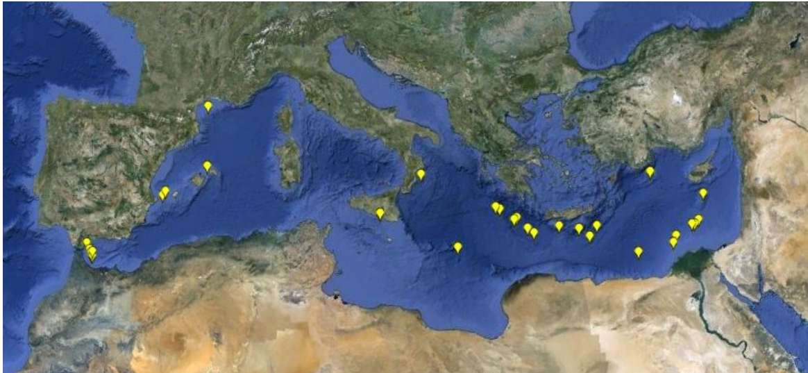
Figure 3: Localisation des peuplements chimio-synthétiques ayant fait l'objet d'étude en Méditerranée (d'après auteurs du document [6], [12],[13], [14],[15]). Fond de carte: Google earth ©.

Les « suintements froids » semblent bien représentés le long de la ride méditerranéenne (bassin oriental; Figure 3). Les « volcans de boues » sont fréquents dans le bassin oriental en particulier au niveau de la ride méditerranéenne, et dans le sud-est du bassin, mais la découverte de « pockmarks » autour des îles Baléares laisse également envisager leur existence dans le bassin occidental (Acosta et al. , 2001, in [12]; Figure 3). Enfin six bassins anoxiques hyper-halins ont été localisés au niveau de la ride méditerranéenne [4] (Figure 3).