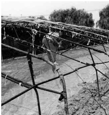
Une grande partie de la consommation de bromure de méthyle en Chine est destinée à la fumigation des sols dans les serres.

La Réunion Consultative, organisée conjointement par l'Administration du