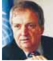
Dr Klaus Töpfer, Directeur Exécutif, PNUE

La 11ème Réunion des Parties n'aura pas pour seul but de déterminer la Reconstitution du Fonds Multilatéral pour 2000-02. Au cours de cette réunion il pourrait également être décidé d'ajuster et d'amender le Protocole de Montréal. Cette Réunion revêtira une importance extrême et aura une portée historique : en effet, elle permettra de consolider d'anciens accords et d'établir notre orientation pour l'avenir. Une attention particulière devra être accordée aux besoins spécifiques des pays en voie de développement et au rôle essentiel que joue le Fonds Multilatéral en encourageant la coopération internationale pour la protection de la couche d'ozone. Si les Parties sont guidées par le principe de 'responsabilités communes et individuelles', la réussite est assurée.