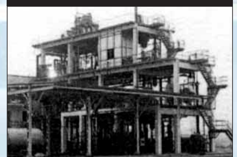
Usine de production de HFC 134a

Contact : PNUE, fax : +33 1 44 37 14 74 e-mail : ozonaction@unep.fr