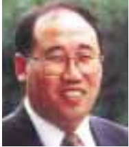
Mr Xie Zhenhua, Ministre d'Etat chargé de la Protection de l'Environnement, Chine

Après avoir célébré le 50ème anniversaire de la République Populaire de Chine, Pékin est à présent prêt à accueillir un autre rassemblement important—la 11ème Réunion des Parties au Protocole de Montréal. La Chine est très honorée d'accueillir cet