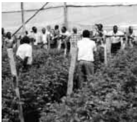
Les participants se sont intéressés sur le terrain aux produits de substitution au bromure de méthyle.

Au cours de l'Atelier de Lilongwe, des experts ont présenté divers systèmes et techniques de Lutte Phytosanitaire Intégrée (LPI) susceptibles de remplacer le bromure de méthyle pour protéger le tabac, les fleurs coupées et autres récoltes horticoles. Un autre point important fut la mise au point de stratégies de formation destinées à promouvoir l'adoption généralisée de produits de substitution. Des démonstrations sur le terrain ont été