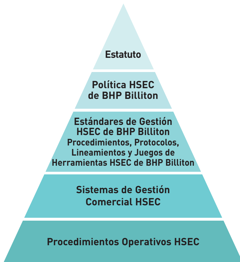
Figura 1. Modelo de Preparación para Emergencias de BHP Billiton

De esta manera, es posible activar cuadrillas de respuesta debidamente capacitadas y entrenadas para responder a una emergencia, en aquellos casos en los que pueden ser de gran utilidad. Es más fácil salvar vidas, proteger el medio ambiente y minimizar los daños a la propiedad cuando se toma acción temprana. Es difícil controlar cuando ya se ha causado daño.