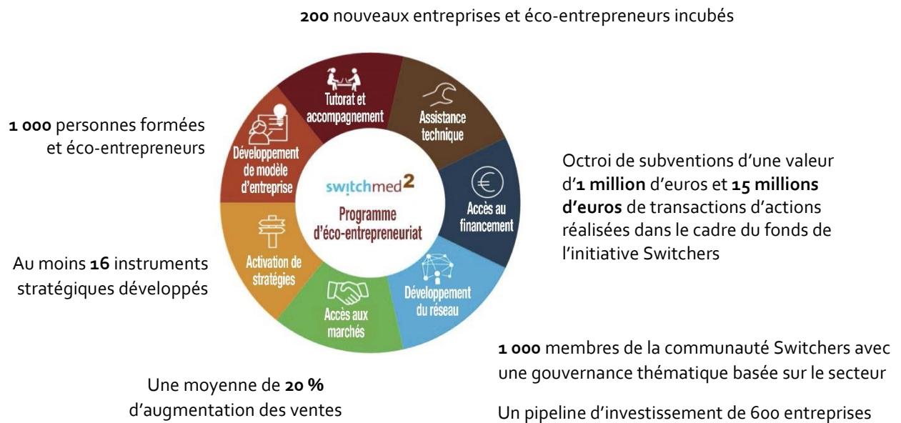
Figure 3 Services de développement d'entreprise anticipés lors de la deuxième phase du Programme pour l'éco-entrepreneuriat dans le cadre de la Stratégie à moyen terme du PNUE/PAM