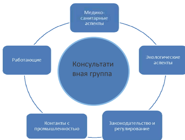
Рисунок 2: Структура консультативной группы и тематических рабочих групп Глобального альянса