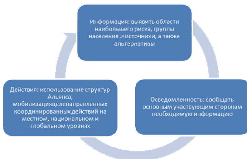
Figure 1: Осуществляемая Глобальным альянсом бизнес-стратегия информации, осведомленности