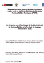
Guía para incorporar aspectos de género, pobreza y empleo verde en los Planes Distritales de Manejo de Residuos Sólidos Municipales (PMRS).

http://www.wiego.org/sites/wiego.org/files/resources/files/mujeres-reciclatoras-baja.pdf