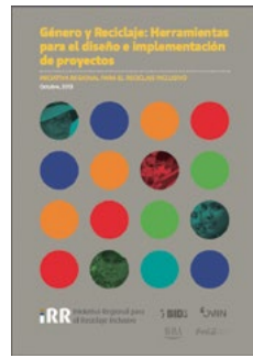
Género y Reciclaje: Herramientas para el diseño e implementación de proyectos

Esta Guía está diseñada para uso en la preparación de proyectos a la formalización de las y los recicladores y su integración en la cadena de valor del reciclaje. A través de la aplicación de las herramientas incluidas en la Guía se pueden identificar y tomar en cuenta sus necesidades en todas las fases del ciclo de proyecto, con el fin de promover la creación y el fortalecimiento de espacios de participación equitativa de mujeres y hombres en los procesos de toma de decisión y en la asignación de responsabilidades asociadas al proyecto.