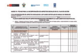
Ficha para la incorporación de aspectos sociales en los planes distritales de manejo de residuos

Ficha que incorpora aspectos sociales en los planes de acción (actividades, metas e indicadores).