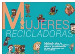
Manual de Debate: Mujeres recicladoras

https://reciclajeinclusivo.org/wp-content/uploads/2014/08/irr-gneroyreciclajeherramientasparaeldiseoeimplementacindeproyectos-140722093301-phpapp02.pdf