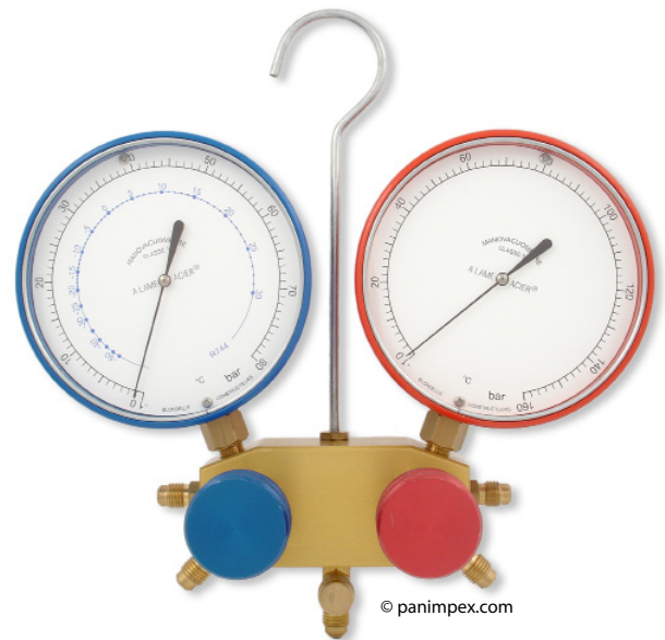
Manifold pour R-744 (jusqu'à 160 bar)