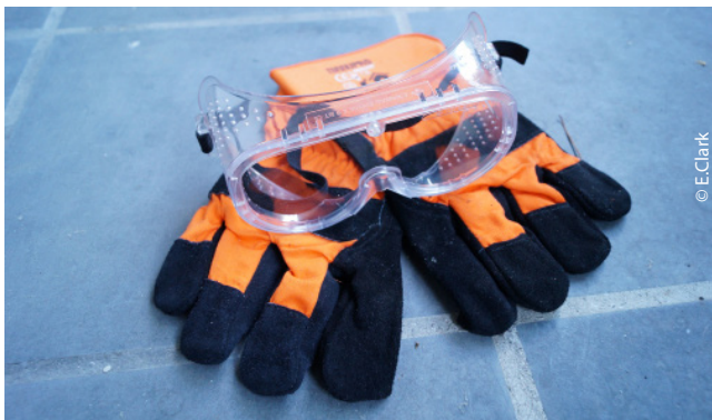
Équipement de protection de base : lunettes et gants