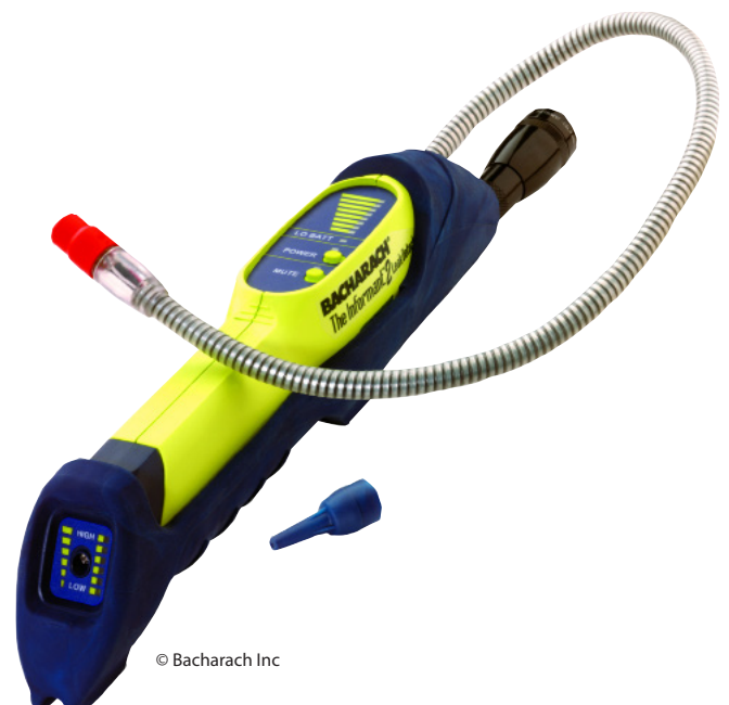
Detector de gas para refrigerantes hidrocarbonatados