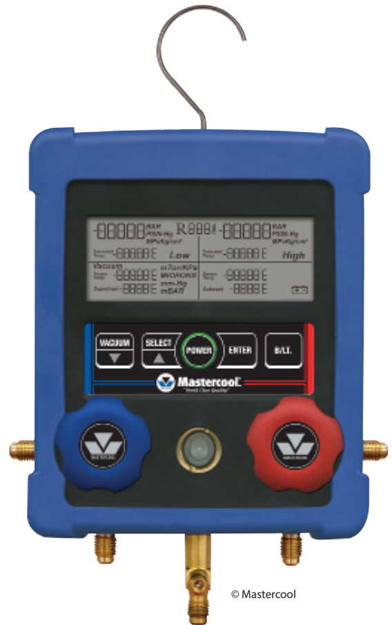
Juego electrónico de manómetros que puede utilizarse con refrigerantes inflamables

Para los técnicos e ingenieros que trabajan directamente con refrigerantes de alta presión, resulta esencial contar con herramientas y equipos adecuados y que además estos se utilicen. Mientras que es frecuente que las mismas herramientas y equipos sean apropiadas para la mayoría de refrigerantes, existen algunos que podrían comprometer la seguridad, por lo cual se requieren implementos especializados.