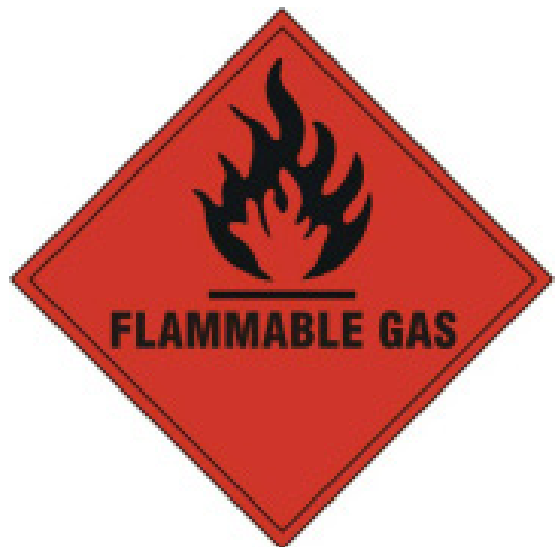
Aviso alertando la presencia de gases inflamables que debe colocarse sobre los cilindros de recuperación de refrigerantes inflamables