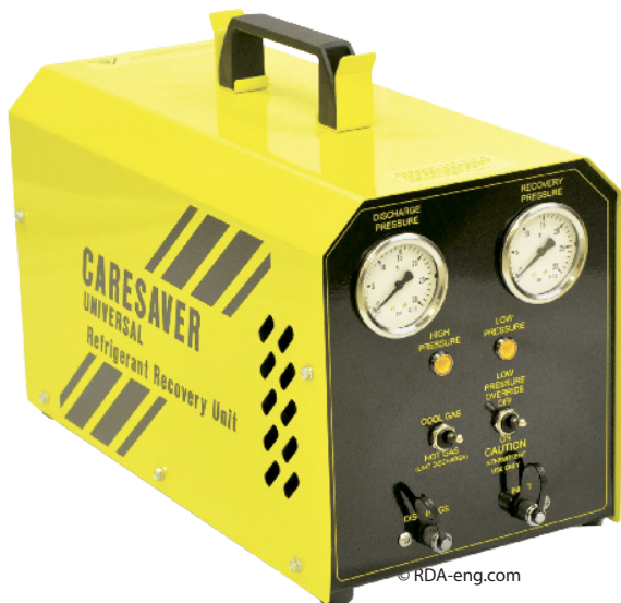
Máquina para recuperar hidrocarburos refrigerantes