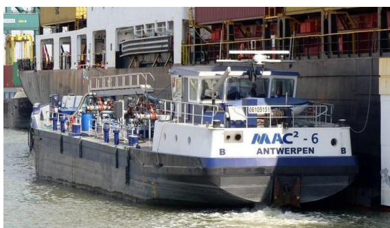
Barge de collecte des résidus liquides contenant des hydrocarbures