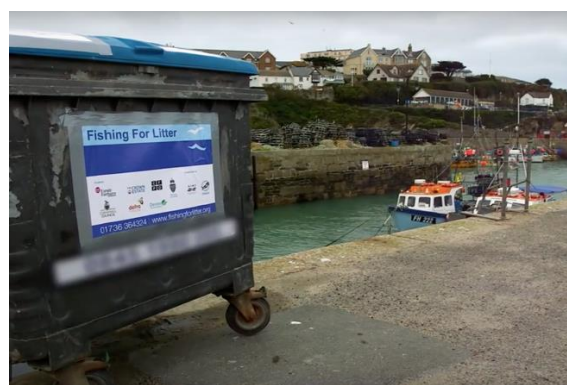
Conteneur de réception des déchets pêchés passivement

138. Il est à noter que, pour éviter que les coûts liés à la fourniture d'une PRF (y compris le traitement des déchets pêchés passivement) ne soient entièrement imputés aux pêcheurs, ce qui ne les encouragerait pas à participer à de telles initiatives, plusieurs gouvernements appliquent des systèmes de financement ou des fonds alternatifs, y compris à travers des fonds nationaux et/ou