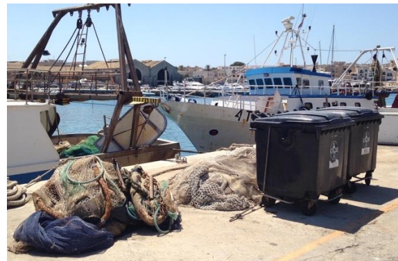
Réceptacles à ordures en Sicile (Italie)