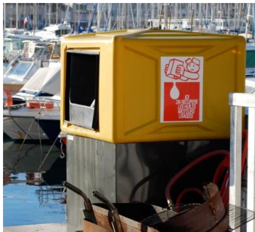
Réceptacle pour huiles usagées dans la marina de Marseille (France)

224. Dans les marinas, il n'est pas toujours nécessaire de fournir des installations de réception de grande ampleur et sélectives. Dans ces ports, le principal type de déchets d'exploitation des navires étant des ordures et des déchets ménagers, des réceptacles généraux, conçus pour la collecte des principaux déchets ménagers, seront suffisants. Les matériaux d'emballage en plastique, en papier et en carton, les canettes de boissons et les boîtes alimentaires en aluminium, étain et acier, les bouteilles en verre et en plastique, etc. devront tous être acceptés par les PRF dans les marinas.