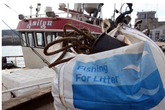
Grand sac utilisé pour la collecte à bord des déchets pêchés passivement au Royaume-Uni

136. En coopération avec les parties prenantes régionales et/ou nationales, les navires participants se voient remettre des sacs résistants pour collecter les débris marins pris dans leurs filets au cours de leurs opérations normales de pêche. Les sacs ainsi remplis sont déposés sur les quais dans les ports participants, où ils sont ensuite transférés par le personnel du port vers des bennes ou poubelles dédiées afin d'être éliminés. Les déchets d'exploitation ou d'office produits à bord, qui relèvent de la responsabilité du navire, restent pris en charge via les systèmes de gestion des déchets établis des ports.