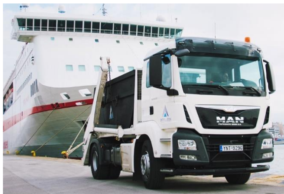
Collecte mobile dans le port du Pirée (Grèce)