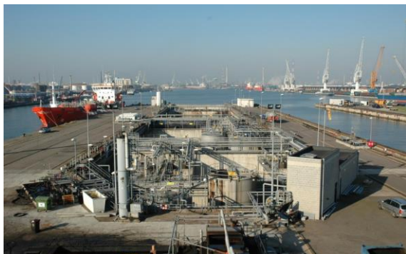
Installation de réception et traitement fixe