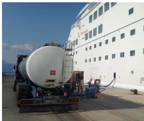
Citerne collectant les déchets liquides d'un navire de croisière

221. Dans les ports de passagers, où les mêmes navires font souvent escale, de manière fréquente et régulière, des installations spécifiques peuvent être mises à disposition pour faciliter la collecte rapide des déchets liquides, comme les eaux usées, à l'aide de raccords de conduites normalisés.