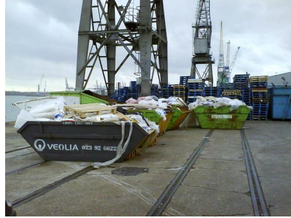
Réceptacles pour ordures provenant des navires