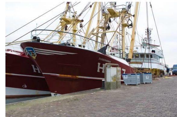
Réceptacles à ordures dans un port néerlandais