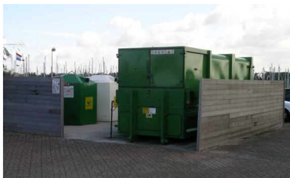
Réceptacles à ordures dans la marina de Nieuwpoort (Belgique)

225. Selon la taille du port (par ex. accueillant de grands yachts motorisés) et du nombre et type de navires y faisant escale, il peut être utile d'équiper l'installation d'une station de pompage pour la collecte des eaux de cale (mélange d'eau et d'hydrocarbures, principalement constitué d'eau) et/ou déchets des toilettes chimiques.