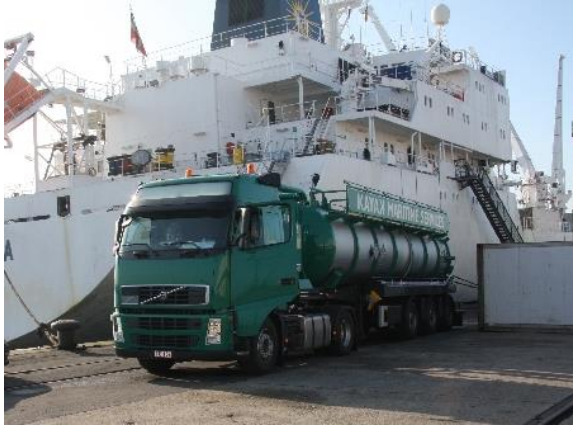
Camion-citerne de collecte des déchets contenant des hydrocarbures

96. Quelques exemples de véhicules et bennes utilisés comme installations de réception :