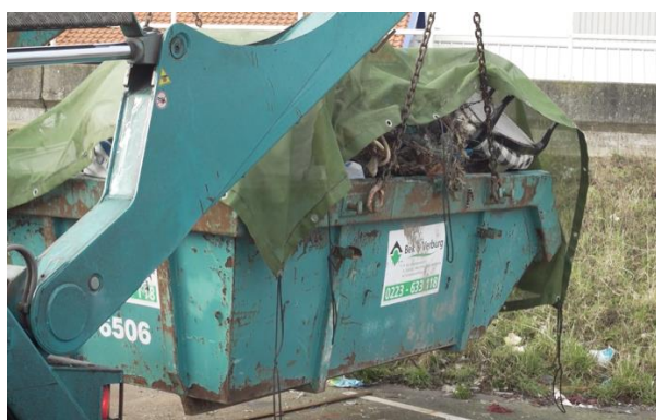
Collecte des déchets pêchés passivement dans un port

137. Des installations de réception sont fournies dans les ports où les pêcheurs peuvent déposer les déchets pêchés passivement. Les déchets pêchés passivement étant généralement très similaires aux ordures d'exploitation des navires, la PRF utilisée pour ce type de déchets est également très similaire.