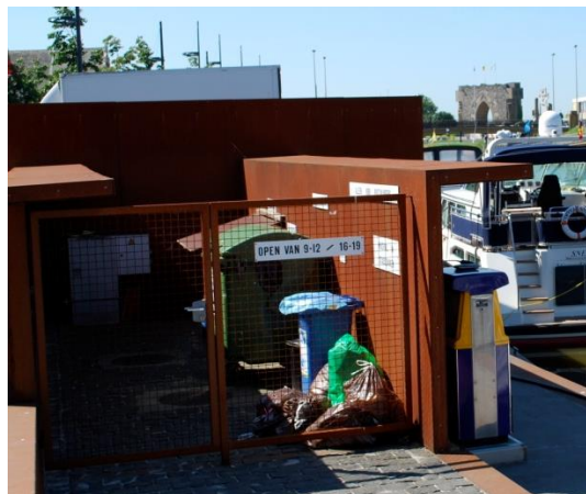
Installation de réception combinée pour les eaux de cale et les ordures dans une marina en Belgique

225. Selon la taille du port (par ex. accueillant de grands yachts motorisés) et du nombre et type de navires y faisant escale, il peut être utile d'équiper l'installation d'une station de pompage pour la collecte des eaux de cale (mélange d'eau et d'hydrocarbures, principalement constitué d'eau) et/ou déchets des toilettes chimiques.