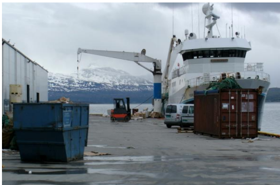
Réceptacles à ordures à Tromsø (Norvège)

223. Les navires de pêche n'ont à déposer qu'un nombre limité de types différents de déchets d'exploitation ; ils peuvent donc en règle générale se concentrer sur la collecte des déchets relevant de l'Annexe I de MARPOL (eaux de cale et huiles usagées) et de l'Annexe V (ordures, y compris les appareils de pêche). En conséquence, la collecte des déchets des navires de pêche peut être organisée relativement facilement à l'aide de camions citernes (pour les eaux de cale) et de conteneurs et bennes (pour les ordures et les appareils de pêche).