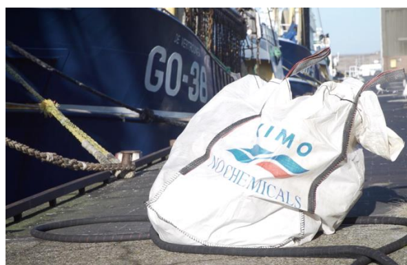
Grand sac utilisé pour la collecte à bord des déchets pêchés passivement aux Pays-Bas

137. Des installations de réception sont fournies dans les ports où les pêcheurs peuvent déposer les déchets pêchés passivement. Les déchets pêchés passivement étant généralement très similaires aux ordures d'exploitation des navires, la PRF utilisée pour ce type de déchets est également très similaire.