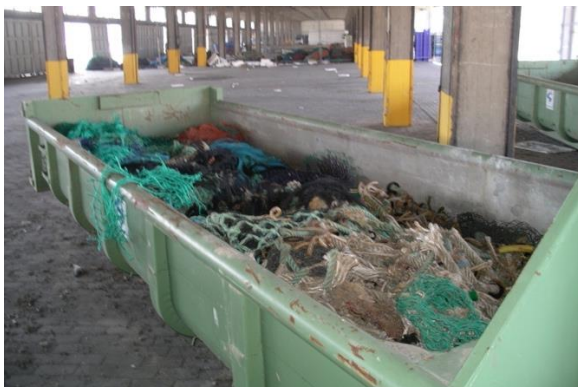
Réceptacles à ordures à Ostende (Belgique)