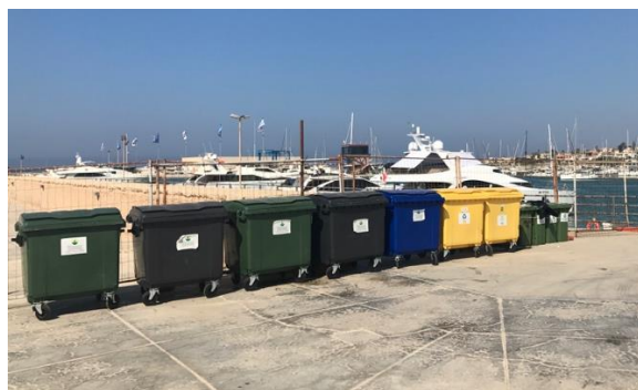
Réceptacles à ordures dans la marina di Ragusa (Italie)