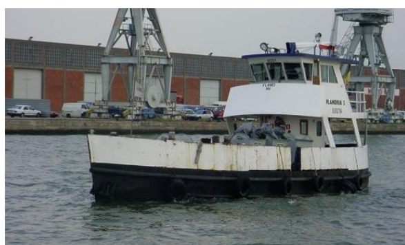
Barge de collecte des ordures uniquement