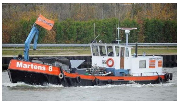
Barge de collecte des ordures