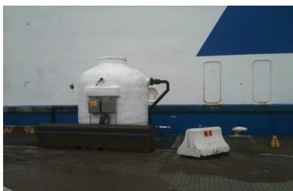
Collecte d'eaux usées dans le port de Trelleborg (Suède)

221. Dans les ports de passagers, où les mêmes navires font souvent escale, de manière fréquente et régulière, des installations spécifiques peuvent être mises à disposition pour faciliter la collecte rapide des déchets liquides, comme les eaux usées, à l'aide de raccords de conduites normalisés.