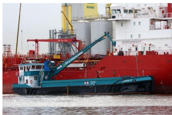
Barge de collecte dans le port de Rotterdam (Pays-Bas)

219. Pour offrir aux navires une flexibilité maximum pour le dépôt de leurs déchets et éviter des retards anormaux, il est possible, dans les grands ports, de prévoir la mise à disposition d'installations de réception 24 h/24 et 7 jours/7.