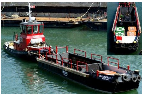
Barge de collecte dans le port de Montréal (Canada)

218. Si les réceptacles sont regroupés sur un site désigné pour la collecte des déchets d'exploitation des navires et les résidus de cargaison, ils peuvent être placés dans un complexe ou abri environnemental, qui est utilisé pour protéger physiquement et visuellement les conteneurs, pour en décourager l'utilisation par des utilisateurs extérieurs au port et pour éviter que les déchets d'exploitation des navires ne soient emportés par le vent.