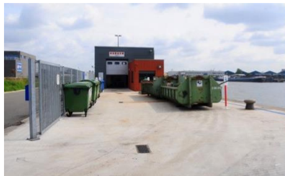
Réceptacles pour la collecte des déchets d'exploitation des navires à un emplacement désigné et couvert