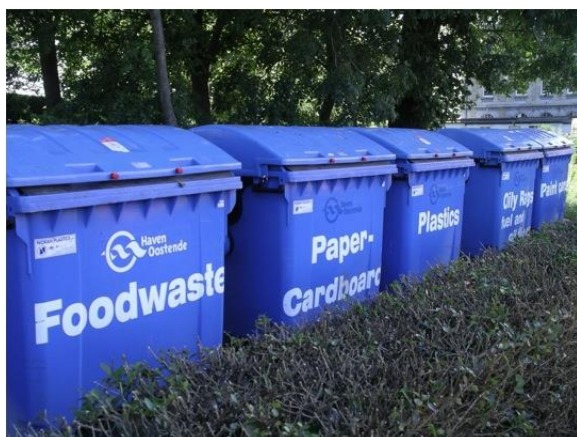
Conteneurs pour ordures, positionnés stratégiquement à une entrée protégée du port