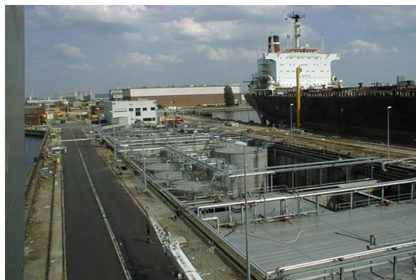
PRF fixe dans le port d'Anvers (Belgique)