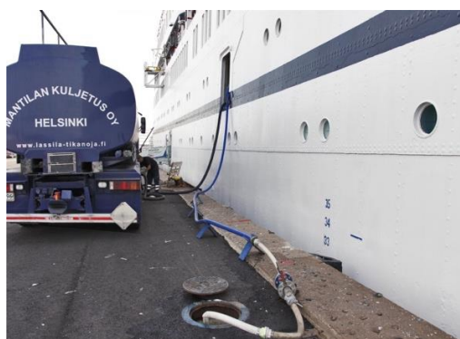
Collecte d'eaux usées dans le port d'Helsinki (Finlande)