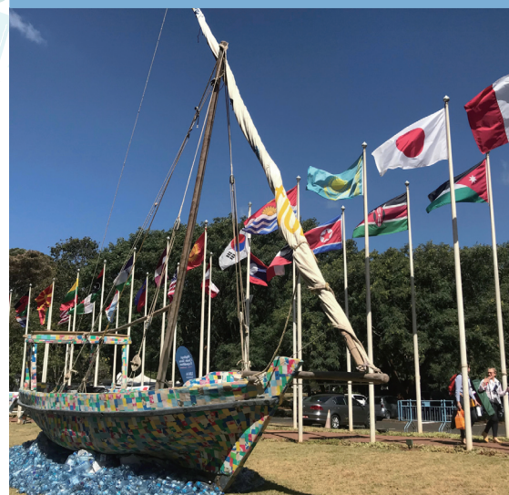
第4回国連環境総会 (UNEA4)