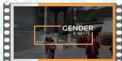
『ジェンダーと廃棄物の関係 (GENDER AND WASTE NEXUS)』