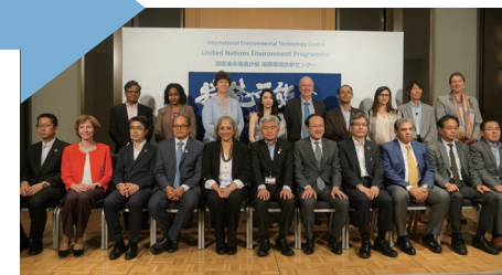
プラスチックごみ問題に関するUNEPシンポジウム ～海洋プラスチックごみ削減をめざして～