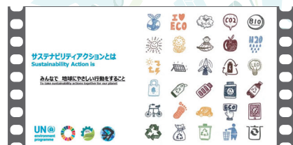
UNEPサステナビリティアクション・キックオフビデオ/プロジェクト紹介ビデオ