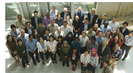
水銀廃棄物の適正管理に関連したワークショップ