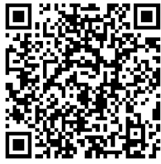
فيديو: المبادرة الوطنية

الحملات الإعلامية: تم إنتاج مقاطع فيديو/إذاعية بالتعاون مع وزارة البيئة، وبثت في جميع أنحاء البلاد.