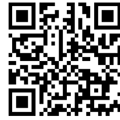
فيديو: الانفصال عن البلاستيك