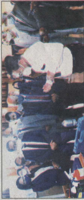
L'Onudi a remis hier au Medd des matériels pour préserver la couche d'ozone.