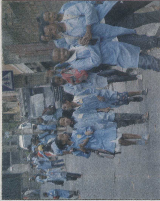
Les parents n'ont aucune charge à payer dans les écoles publiques.

Dans le souci de promouvoir la transparence, il a été indiqué que la gestion du budget de l'Etat et les cotisations des parents d'élèves, qui sont toutes gérées par la Fefi, seront faites séparément. A noter que les «Crises des écoles» sont également