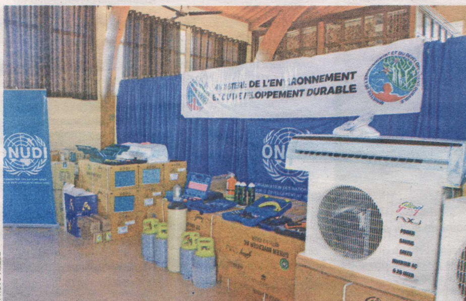
Les dons de matériels et équipements remis au MEDD à Nanisana, hier.

Les effets sont très lourds pour les populations de la terre, comme les différentes maladies de la peau (cancer et le vieillissement de la peau), la cataracte, l'affaiblissement du système immunitaire, le trouble de la photosynthèse des plantes, l'affaiblissement des