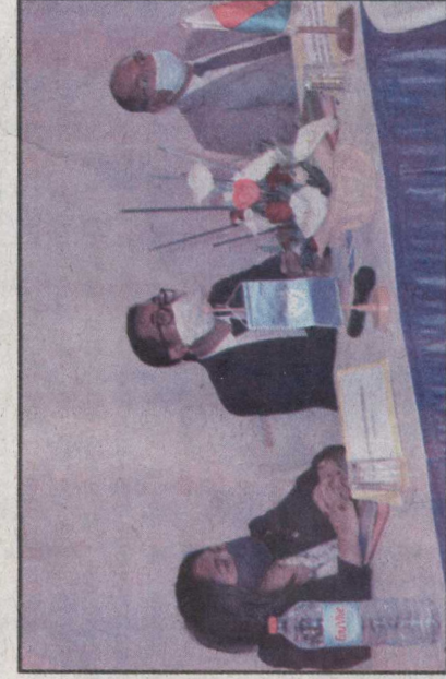
Lors de la célébration de la Journée mondiale de la protection de la couche d'ozone