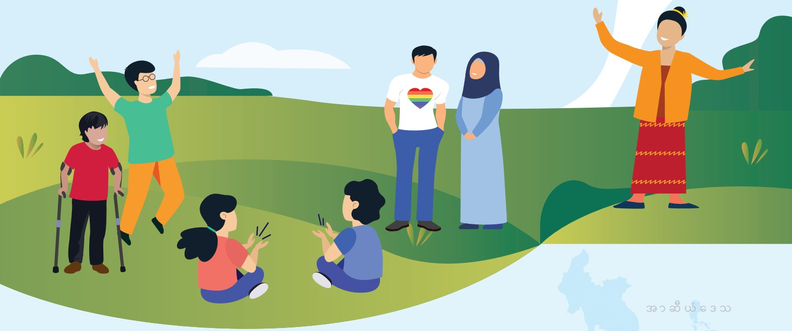
အာ ဆီ ယံ ဒေ သ