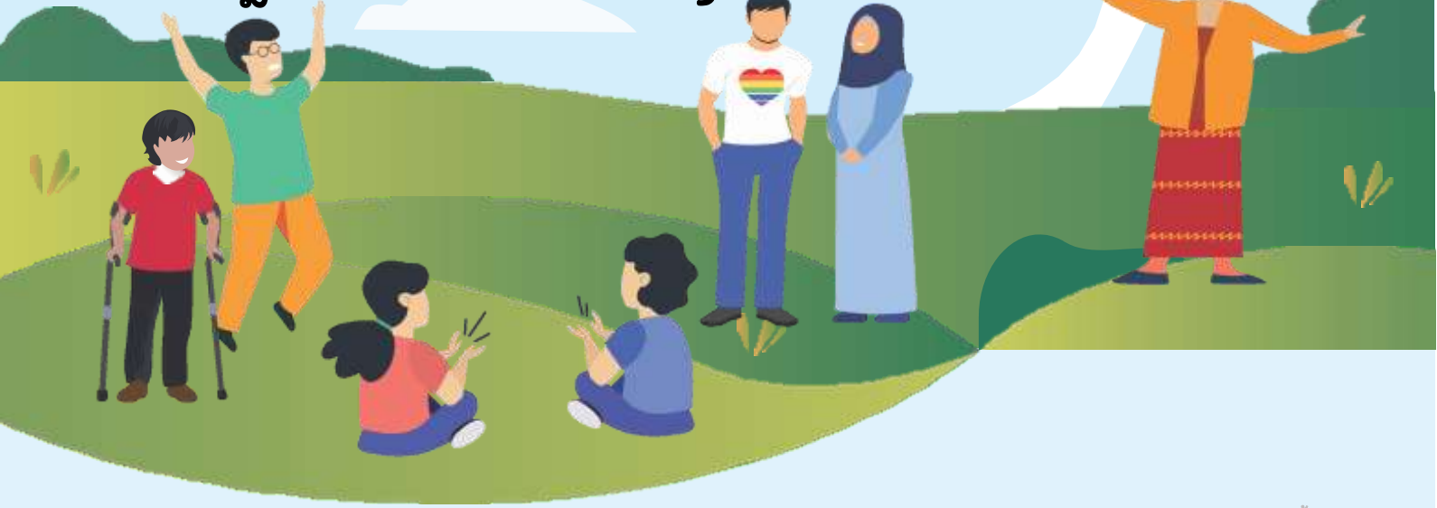
ພາກພື້ນອາຊຽນ