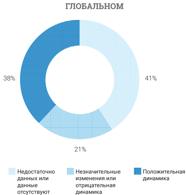
Рис. Е.2 Динамика наличия данных для показателей ЦУР, связанных с окружающей средой, на глобальном уровне

В 2022 году на глобальном уровне из 92 показателей, связанных с окружающей средой, 38 процентов продемонстрировали положительные изменения, что свидетельствует об улучшении состояния окружающей среды, а для 21 процента показателей отмечались незначительные или отрицательные изменения. Больше всего показателей, демонстрирующих положительные изменения, относится к ЦУР 9, связанной с инфраструктурой, ЦУР 7, связанной с энергетикой, и ЦУР 6, связанной с пресной водой.