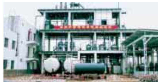
La Xi'an Jinzhu Chemical Industry Co. Ltd, première usine pilote de HFC-134a en Chine, mise en service en mars 1999. Le procédé technique pour cette usine, qui a une capacité annuelle de 2000 tonnes, a été mis au point par le Xi'an Modern Chemistry Research Institute. La Chine prévoit la création prochaine d'une autre usine de HFC-134a qui devrait avoir une capacité annuelle de 500 tonnes.