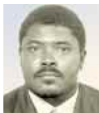
Dr Donald Cooper Directeur, Département des services de santé environnementaux, Bahamas

L'action menée par les Parties au Protocole de Montréal et ses amendements est entrée dans une nouvelle phase. Cette année, pour la première fois, les mécanismes de contrôle obligatoire sont appliqués aux pays de l'Article 5. La plupart des Parties de l'Article 5 ont déjà